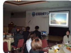
フォトコンテストの作品紹介の様子。スクリーンを使って皆様にお披露目いたしました。