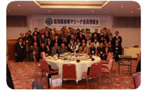
中締め後、出席者全員の集合写真を撮らせていただきました。