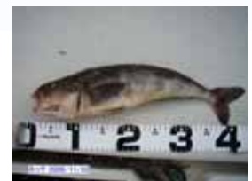
こちらは、ホッケです。アイナメにとっても良く似ています。