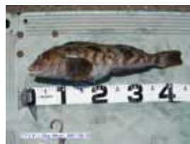
アイナメは感覚器官である「側線」を5つも持っている非常に敏感な魚です。