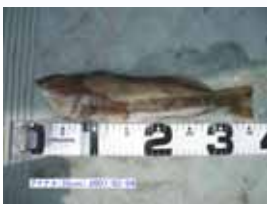
昨年2月に釣れた黄色の婚姻色のアイナメです。メスの産卵後はオスが卵を守るそうです。