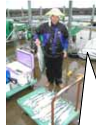
合計12匹!釣れました! ~2003/4~