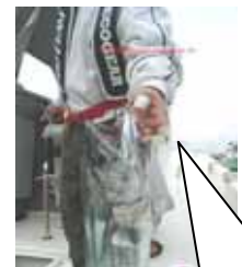
この鋭い歯を見てください! い!