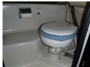
船内に設置された船外排出型のトイレ