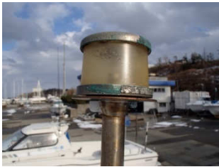
■経年劣化によりレンズが曇ったものは危険です!!

しかし、ご自分で旧基準の航海灯（現在船に設置されているもの）の “電球だけ” を市販のLED電球に交換しても検査は合格しませんので、その点はお気を付け下さい。