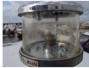
■旧基準品でも比較的新しいものは問題ありません。