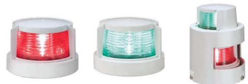
■現在販売されている新基準適合品の船灯（航海灯）。各社素材やデザインに工夫が凝らしてあります。

新基準船灯はすでに発売が始まっておりますが、現在製造メーカーの供給体制の都合によりお待ち頂く場合があります。交換をお考えの際はお早めにご注文をお願いいたします。