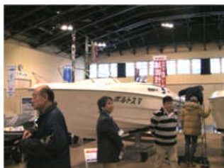
各メーカーから発表されるニューモデルが展示されています。