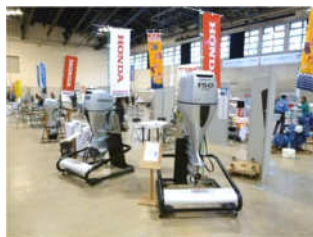
ボートや船外機、航海計器なども展示されており、実際に見て乗って触ることができます。