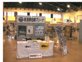
柏崎マリーナも出展しており、施設の概要やクラブ等の活動内容を紹介します。