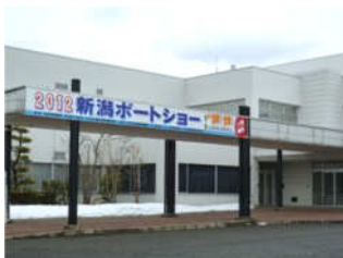
北陸道新潟中央インターを降りてすぐにある新潟市産業振興センターが会場です。