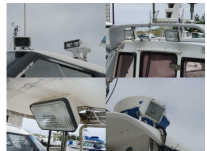
■従来型のサーチライトやデッキライト類は消費電力の高いものが多いので、LED照明への交換をお勧めいたします。