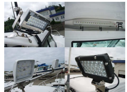
■当マリーナでも高性能・低価格のLED照明を取り付ける方が、最近普及してきました。

特にLED照明については高価なイメージがありましたが、一時期よりかなり購入し易い価格になって来ていますし、何より従来型ハロゲン灯などと比べ消費電力が格段に低く、長寿命となっていますので、夜釣り派の方には朗報と言えるのではないのでしょうか。