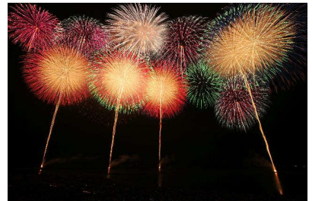
■「海の大花火大会」の写真。

※花火大会当日の陸上および海上交通規制図等は、時期が近づきましたらマリーナに準備いたしますので必ずそちらをご覧ください ※花火大会当日、マリーナの正門には専属の警備員を配置いたします。