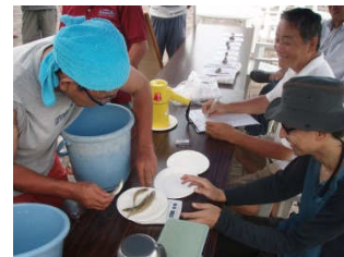
帰港後の検量の様子。