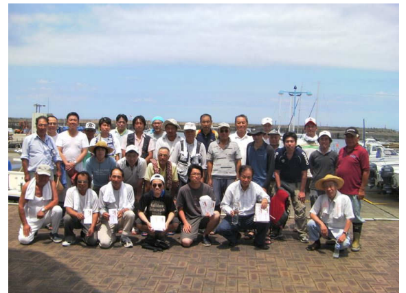
参加艇 15 艇、参加者数 34 名で順位が争われました。釣果の差こそあれ、皆さん和気藹々とした雰囲気の中、大会を楽しんでいただけたようです。

※「中物賞」とは、1匹の重量で競われる「大物部門」において次点の成績となった方へ贈られる賞の事です。