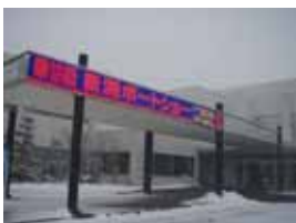
あいにくの天候にもかかわらず大勢の来場者がありました。

マリーナとしては来年も引き続き出展する予定でありますので、お時間のある方はぜひ会場まで足をお運びください。