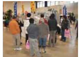
会員の皆様もお立ち寄りくださいました。