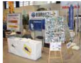
柏崎マリーナの展示ブース