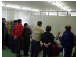
模範実技のようす