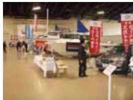
実際に各社ボートが展示されています。