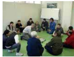
心配蘇生法の実技