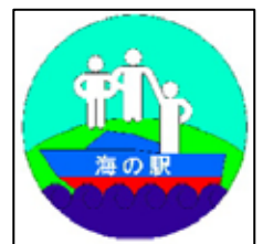
かしわざき「海の駅」 新潟県柏崎マリーナ

本州の日本海側には秋田県の「由利本荘マリーナ」以南に海の駅が1カ所もないこともあり、北陸信越地区の海の駅の果たす役割は今後大きなものとなりそうです。