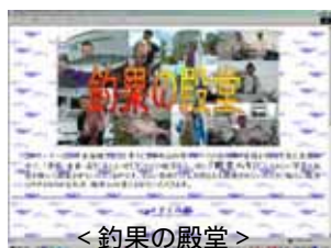
< 釣果の殿堂 >

などなど様々なページがありますので、環境が整っている方はぜひ一度アクセスしてみてください。