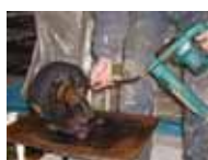
< グリスアップ >