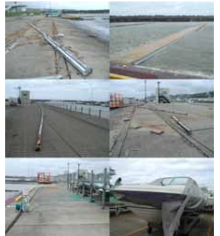
< 台風が通過した後の爪痕 >