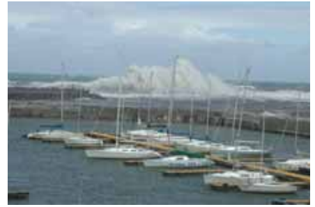
< 台風通過後の吹き返しによる風とうねり >

普段我々が望んでいる佐渡海峡は、新潟港をはじめ、柏崎港、直江津港や対岸の佐渡島小木港などの多くの港湾を抱えており、通行船舶量も増加しておりこの椎谷鼻灯台の持つ意味もますます重要なものになっています。この近辺はよい魚場がたくさんありますが、「 採取禁止区域 」が広範囲に決められておりますので、事前に調べてから釣行にお出かけください。(ロビーに掲示してあります)