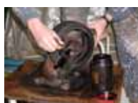
< 塗装 >