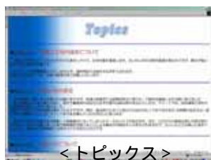
< トピックス >