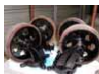
< 完成・取付 >