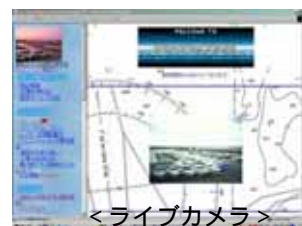
< ライブカメラ >