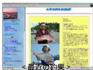
< 最近の釣果 >