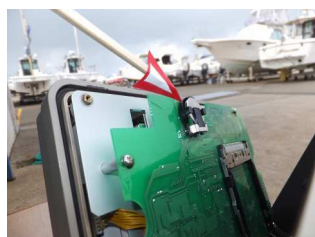
本体内蔵のメモリ電池