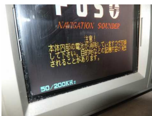
電池残量低下による注意画面

ご依頼される場合には大変お手数をおかけ致しますが、発送中の電池残量不足によるデータ消去などの万が一に備え、念のためご依頼者様側でデータを控えた後にお願い申し上げます。