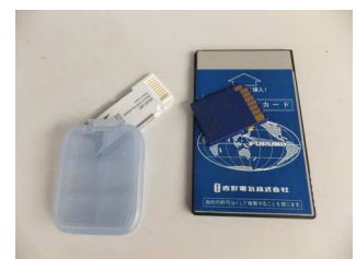
データ記憶用のメモ리카ード類