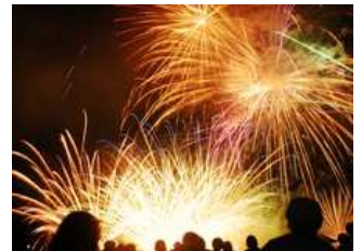
■「海の大花火大会」の写真。