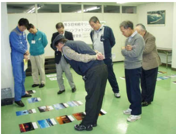
応募締め切り後、審査員が作品の選定を行います。

作品は審査の上、12月1日の会員懇親会会場にて各賞の発表を行う予定です。（入賞者には事前にご連絡させていただきます。）