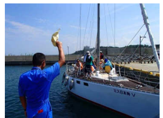
今後もできる限りこのような機会を増やしていきたいと考えております。