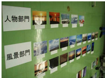
懇親会々場で入選作品の発表が行われます。