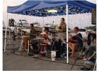
毎度お馴染みのバンドの皆様。夏の夕暮れにぴったりのナンバーが演奏されました。