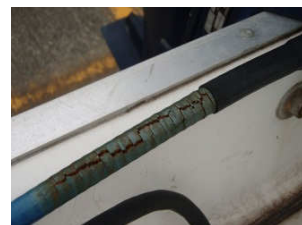
ステアリングケーブルのひび割れ。

例えば出港中に前進用のリモコンケーブルが切れれば、後進のみで帰港しなければなりませんし、ステアリングケーブルが錆で固着して動かなくなれば、そのまま漂流することにもなりかねません。（これらは実際に起こった事象です。）