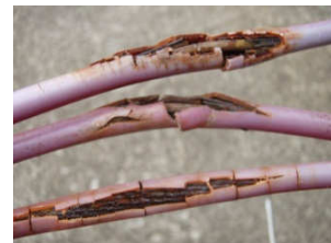
リモコンケーブルの内部腐蝕による破裂。

船には、その他にも各部にはプラスチック・ゴムを使用した樹脂部品が多く有りますが、経年的な劣化に因る部品交換も増えている為に各所、使用時間・年数に応じた定期交換がトラブルを防ぐ防止策であると思います。