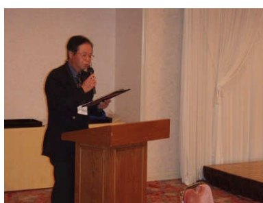
懇親会々場で入選作品の発表が行われます。