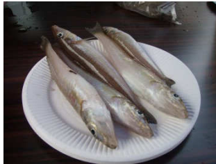
キス5匹の総重量で優勝を争います。