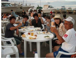
ご家族・お仲間のみなさんと生ビールで乾杯!!