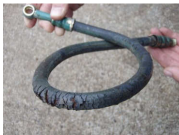
燃料ホースも劣化によりひび割れるとこのように…。