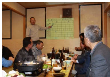
釣具店の商品券などが当たる福引大会。