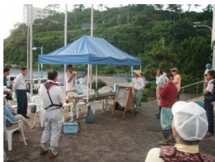
スタート前のミーティングでルールの確認などをします。

なお、大会の詳細はレポートとしてマリーナのホームページ「 第7回キス釣大会結果報告 」にまとめてありますので、そちらをご覧ください。