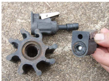
インペラやコネクタ類のゴムが劣化してひび割れています。