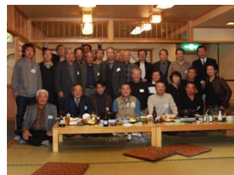
毎年大勢の方々にご出席いただいております。