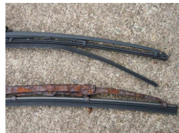
ワイパーブレードのゴムの切れ(上)と腐蝕(下)。