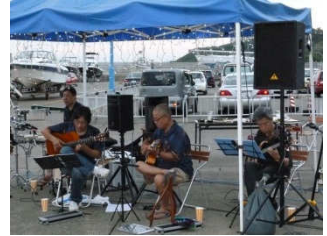
「ロスボラチョス」の皆様。夏の夕暮れにぴったりのナンバーを演奏いただきました。