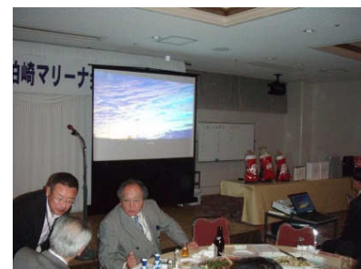
作品はプロジェクターで会場の皆様に紹介されます。