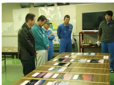
応募締め切り後、審査員が作品の選定を行います。