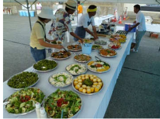
オードブル16種にピザ、そしてメインは和牛ステーキを鉄板で焼きました!