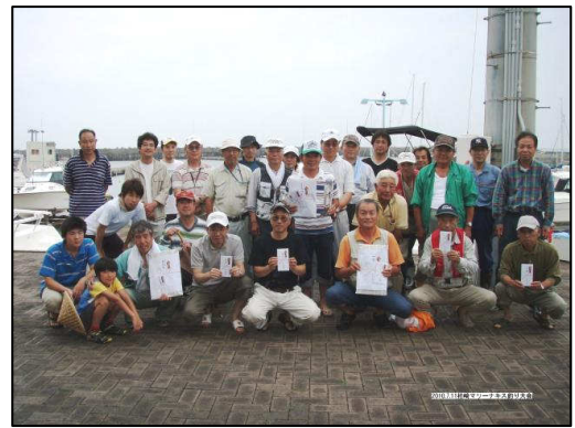
※大会優勝者のトロフィーと写真はマリーナロビー内に展示してあります。

※「マリーナ特別賞」とは、マリーナの開港 20 周年に合わせ、順位が 20 番目の方に贈られた賞です。