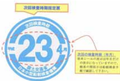
図 1 「次回検査時期指定票」

今後、定期検査または中間検査に合格した船舶に対して 2 枚ステッカーが交付されますので、船体の両舷の見やすい位置に貼り付けることとなります。実際、皆様の船の横には、図 2 のような配置で各ステッカーを貼り付けることとなりますので、知っておいてください。