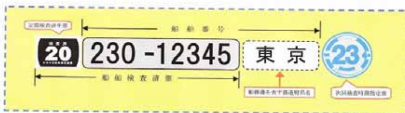
図 2 「実際船に貼られるシール類」 各ステッカーは「船体の両側の外から見やすい位置」に貼り付ける決まりとなっています。

左のステッカーは、「次回の検査時期は平成 23 年 4 月です」という意味です。マリーナでは事前に該当する船舶に対し、船検の案内を送っています。