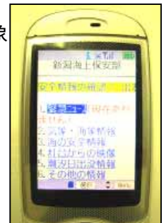
携帯サイトの画面