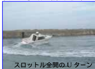
スロットル全開のUターン!