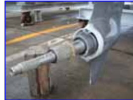
きれいに除去し点検も完了しました。