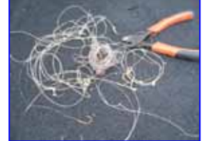
除去した釣り糸類。こんなにありました。