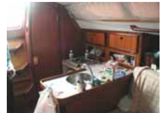
（上）男らしさを感じさせる？シンク周辺 （下）欲しいものが一目でわかる？パウバース

その他にもレイジージャックの遊びをショックコードで調整することによるセールの擦れ防止といったものから、デッキ上で転がっていて足を引っ掛けやすいスピンプールのマストへの設置、落水事故で遭難にもつながることのあるブームパンチ防止のための装置など細かいものまで言えば数え切れない工夫が施されており、驚くことにそのすべてが手作りという点にも関心させられました。元々甥っ子さんの船ということもあり、『返すときに取り外ししやすいように極力加工せずに設置する』という前提があったからこそそのアイデアなのかもしれません。