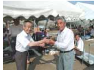
(上)乗船会はベタ風で船酔いした方はゼロでした。 (下)キス釣り大会表彰式にてトロフィーの授与。