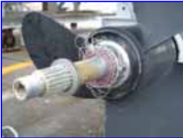
プロペラを外したら釣り糸がこんなにびっしりと!!

プロペラシャフトに釣り糸が巻き付き、オイルシールからオイル漏れを起こすケースが最近増えています。釣りをしていて不幸にもプロペラに糸が絡んでしまったら、帰港した際忘れずに職員までお知らせください。すぐにプロペラを取り外して糸を除去し、オイルシールを点検いたします。表面的に全部除去したつもりでもプロペラ内部にはかなりの糸が残っていることが多く、その時はご自分で取ったつもりでも、後々それが原因でオイルシールがやられ、ギアオイルのオイル漏れにつながることも多いのです。(その殆どが化学繊維である釣り糸は、プロペラの高速回転による摩擦熱で高温となり、水あめのように溶けだしてオイルシールのパッキンを溶かしてしまう)釣り糸が絡むのはよくあることですが、初期の段階できちんと対処しておけば出費もかさまらずに済むことが多いので、お気を付けいただきたいと思います。