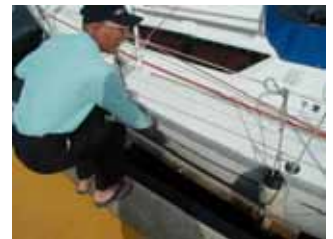
ゲタを履かせた係留用フェンダー

そのほんの一部をご紹介させていただきますと、まずは照りつける直射日光から身を守るための日除け。長距離ならずとも必須の装備の一つですが、お金を出して買うのは誰でもできること。