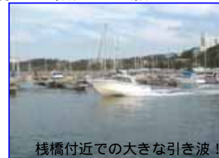
桟橋付近での大きな引き波!