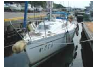
バウのフェンダーは心配した甥っ子さんが取付けたもの