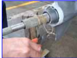
巻き付いた釣り糸は残らず切り取ります。