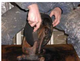
① 取り外し・錆落とし

消耗品とはいえ、キャスターが出来るだけ長く使用できる様なメンテナンスを心がけておりますので、マリーナでのメンテナンスをご希望の方は、お早めにお申し出ください。（翌年以降、特にお申し出がない限りは毎年作業をさせていただいております。）