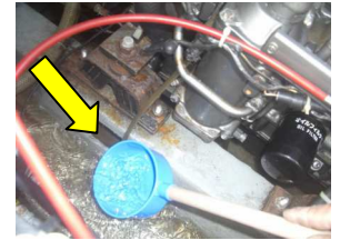
ひしゃくを使った排水も効果的です！

オート（自動）ビルジポンプの設置も有効ですが、メインスイッチに関係無く自動で作動する為、バッテリー上がりへの配慮が必要となります