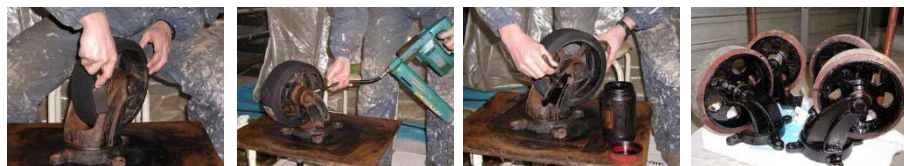
①外し・錆落とし ②グリスアップ ③防錆塗装 ④完成・取付け

消耗品とはいえ、キャスターが出来るだけ長く使用できる様なメンテナンスを心がけておりますので、マリーナでのメンテナンスをご希望の方は、お早めにお申し出ください。(翌年以降、特にお申し出がない限りは毎年作業をさせていただきます。)