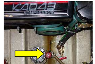
ビルジポンプの設置場所を把握しておいてください。

ポンプの不具合も内部で固着しているケースが多いので、固着防止と点検を兼ねて時折スイッチを入れてみてはいかがでしょうか。