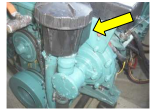
海水フィルターのふたのゆるみからも浸水します！