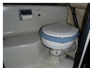
船内に設置された船外排出型のトイレ