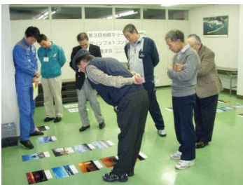
応募締め切り後、審査員が作品の選定を行います。

作品は審査の上、12月1日の会員懇親会会場にて各賞の発表を行う予定です。（入賞者には事前にご連絡させていただきます。）