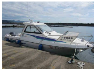
23ft 船外機でも時期さえ間違えなければ安全に遠くへ行くことが可能です。