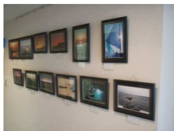
入選作品は、一年間マリーナに展示され、HPでも紹介されます。