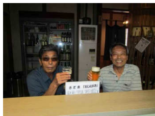
旅の楽しみの一つでもある地元の方々との交流。