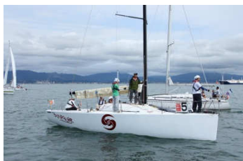
スタート前のサンパワーの雄姿。クルーの皆さんの緊張感が伝わってきます。