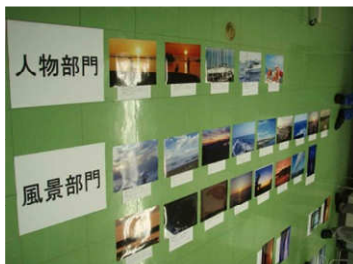
懇親会々場で入選作品の発表が行われます。