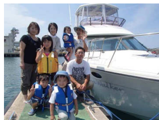
当日は海面も穏やかで、美しい柏崎の海岸線を満喫していただけただけではないのでしょうか。