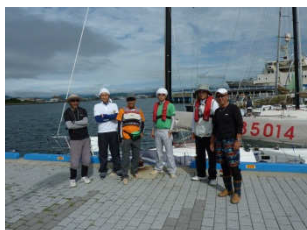
「柏崎外洋ヨットクラブ」が誇るベテランクルーの面々。