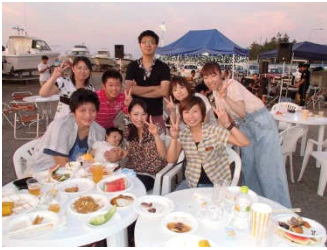
ご家族・お仲間みなさんと生ビールで乾杯!!

今回の夏の懇親会は、冬の懇親会と同様に今後も毎年恒例の行事として実施していく予定であります。同じマリーナで遊ぶ仲間として、このように一同に会する機会はなかなかないものです。我々も皆様の懇親の場としてご活用いただければ幸いです。ご都合が宜しければ是非ご参加くださいますようお願いいたします。