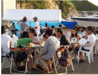
お食事はオードブルや牛ステーキの炭火焼きなどが出されました。