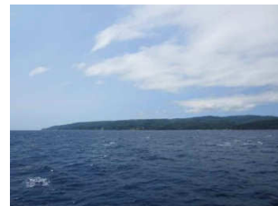
ようやくたどり着いた奥尻島。まだ見ぬ地への強い思いが船を島に導いたようです。

航海の詳しい内容はホームページ「マイボート航海ひとり旅」(柏崎マリーナのリンク集でご紹介しています。)をご覧ください。いつかは遠くへ一人旅に出たいと思っていた方には非常に参考となる内容です。