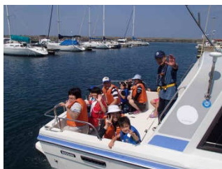
オーナーの皆様には、何から何までご尽力いただき、誠にありがとうございました。