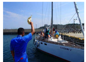
今後もできる限りこのような機会を増やしていきたいと考えております。