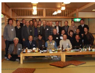
毎年大勢の方々にご出席いただいております。