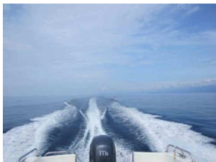
広い海面をマイボートと共に疾走する喜び!