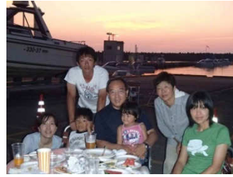
きれいな夕陽をバックにご家族で記念撮影!!