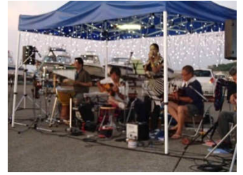
毎度お馴染みのバンドの皆様。夏の夕暮れにぴったりのナンバーが演奏されました。