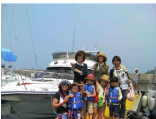
1 回目となる 7 月の乗船会は親子限定だったこともあり、大勢の子供さんが乗船しました。

夏休み期間中ということもあってお子様連れでの参加者も多く見られ、子供たちにとっても良い思い出になったのではないのでしょうか。