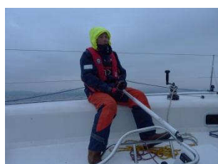
津軽海峡では早い潮流と無風地帯での帆走に苦労させられたそうです。