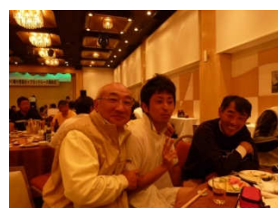
レース前とレース後のレセプションもヨットレース参加の楽しみの一つです。