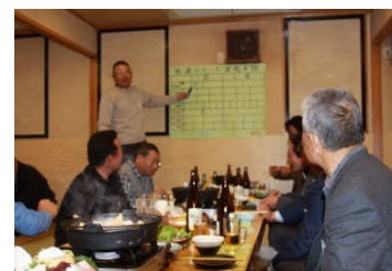
釣具店の商品券などが当たる福引大会のようす。