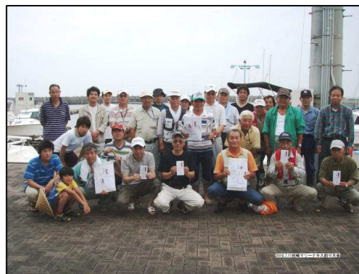
※大会優勝者のトロフィーと写真はマリーナロビー内に展示してあります。

※「マリーナ特別賞」とは、マリーナの開港 20 周年に合わせ、順位が 20 番目の方に贈られた賞です。