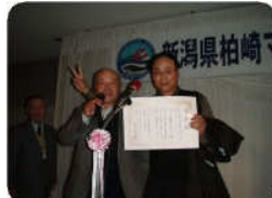
年間大物賞の授賞式の様子。実力と気力・体力を持ち合わせた方に勝利の女神は微笑みします。