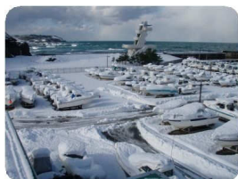
15 日時点での積雪量はマリーナ内で約 120cm となり、海沿いとしては記録的な積雪量となりました。