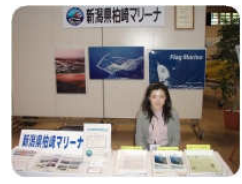
柏崎マリーナの出展ブースです。施設の概要や活動内容を紹介しています。