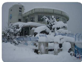
管理棟まわりも雪景色となってしまいました。