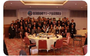
中締め後、出席者全員の集合写真を撮らせていただきました。