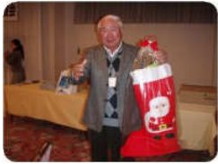
恒例のピンゴゲームでは、皆さん豪華景品に盛り上がっておられました。

現在、懇親会当日の様子を写真に収めたものをマリーナのホームページで公開しておりますので、パソコンをお持ちの方はぜひご覧になってみてください。(ご覧いただくにはパスワードが必要となります。お手数ですがマリーナまでお問合せ下さい。)