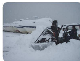
週末の出港に対応する為、フォークリフトを使用し急ピッチで除雪をしている様子。