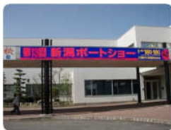
北陸道 新潟中央インターを降りてすぐにある「新潟市産業振興センター」が会場です。

モーターボート中心ではありますが、会場イベントや各社マリリングッズの販売なども行なっておりますので、ご都合のよろしい方はぜひ足をお運びください。