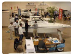
ボートや船外機、航海計器などが展示されており、実際に見て・乗って・触ることが出来ます。