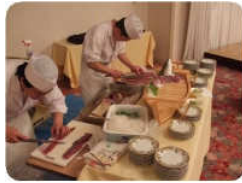
ご提供いただいた魚は、板前さんにお造りにしていただきました。