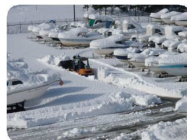
各保管艇の前に通路を作るため、フォークリフトで雪を押し、溜まった雪は海へ捨てています。