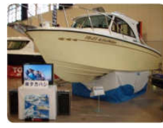
各メーカーから発表されるニューモデルが展示されています。