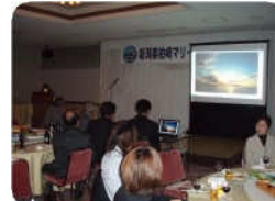
フォトコンテストの作品紹介の様子。スクリーンを使って皆様にお披露目いたしました。