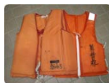
このように前の持ち主から引き続き使用している物は、何度も書き直しをされ、漂流者の身元を割り出すという本来の目的を果たしません。