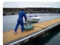
カートに荷物を載せて、直接棧橋までお入りいただけるようになりました。