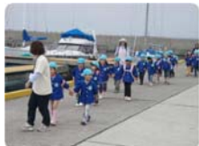
ヨットやモーターボートを間近に見て、園児たちも興奮気味でした。

去る5月22日（金）に、市内の保育園より69名の皆様がマリーナの施設見学にいらっしゃいました。当施設の見学は初めてとあって、園児の皆さんにも引率の先生方にも喜んでいただけたようです。今後ご要望に合わせ、地域貢献活動の一環として出来るだけ施設見学を実施していきたいと思っております。ロビーに当日の詳しい様子を写真と共に掲示しておりますので、マリーナにいらした際にご覧ください。