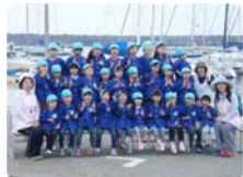
棧橋の前で記念撮影。皆さん笑顔で「ハイッ、チーズ！」