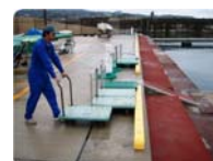
ご使用后、カートは所定の位置にお戻しください。