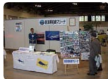
柏崎マリーナのブース前です。釣果写真に足を止める人が多かったようです。