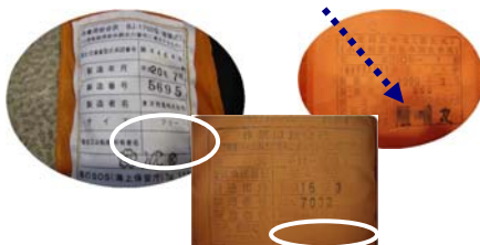
救命胴衣には、このように船名・所有者名を記入する場所がありますので、必ずご記入ください。

船の備品のうち、救命胴衣は乗船者の命を守る一番大事なものといっても過言ではありません。日頃から救命胴衣の保守管理・点検を心がけ、損傷の激しい物・使用年数の古い物はいざというときに役に立ちませんので、ご自分が着る分のみならず乗船者の分も含めお早めに交換してください! あらゆる海難事故の教訓からも、救命胴衣着用の重要性は明らかです。皆さんが船長として乗り込む以上、自分も含めた乗船者全員が安全に楽しめるような環境作りをすることが、船長としての一番の遵守事項と法律でも謳われていることを自覚してください。