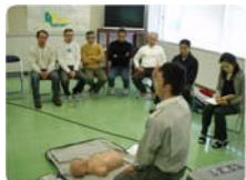
柏崎消防署・救急隊の皆さんを講師にお迎えしての講習です。

昨年同様、今回もこの講習を受講した方全員に柏崎市消防長より「 普通救命講習 I 」の修了証が発行されました。講師の方も「 今回講習を受講された方も、救命技能を忘れることなく維持向上させるため、毎年講習を受けてください。そして、今回受講されなかった方はぜひ一度講習を受けていただきたい。 」とおっしゃっていました。