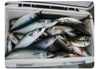
大きな群れに当たれば、1時間程度でクーラーBOXが満杯!になることも…。

しかし、「 サバの生き腐れ 」とよく言われるように、サバは釣り上げられたそのときから腐敗が始まる魚と言っても過言ではありませんので、釣り上げたらすぐにめて、血抜きをし、家に持ち帰るまでは、氷を入れたクーラーボックスに海水を入れ十分に冷やして保存しておいてください。そうすれば、釣人の特権である新鮮なサバの刺身や鰯をご堪能いただけます。