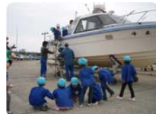
マリーナ専用艇「米峰」にも実際に乗り込んでもらいました。男の子はハンドルを握って大喜びでした！