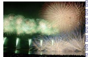
「海中スターマイン」は柏崎でしか見られない珍しい花火です。ぜひ一度ご覧ください。

※花火大会当日の陸上および海上交通規制図等は、時期が近づきましたらマリーナに準備いたしますので必ずそちらをご覧ください。