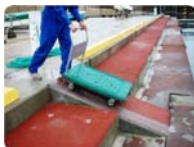
この斜路部分の幅を拡げました。傾斜がありますので荷物にはご注意ください

オーナーズクラブさんからの提案もあり、このたび平面保管艇の一時係留棧橋（小型棧橋）へ降りる通路の拡幅工事を行いました。従来は、カートにクーラーボックスなどの荷物を乗せ、棧橋へ入ることはできませんでしたが、今回通路の拡幅工事を行ったことにより、ご自身の船が係留してある場所までカートで荷物を運ぶことができるようになりました。