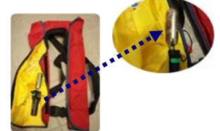
膨張式の救命胴衣にはこのようにポンペが内蔵されています。腐食してガスが漏れると、いざというときに膨張しません。