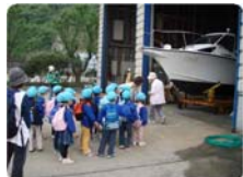
修理工場にて「船のお医者さん」として紹介されたサービススタッフ。