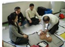
正しい心臓マッサージを行う為にも、毎年講習を受講しましょう。