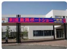
今年で第19回目となる新潟ボートショー。今年は4月の開催となりました。

来年も引き続き出展する予定でありますので、お時間のある方はぜひ会場まで足をお運びください。