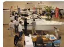
各社特色のあるニューモデルボートが展示してありました。航海計器類も安価で高性能なものがたくさん出展されていました。