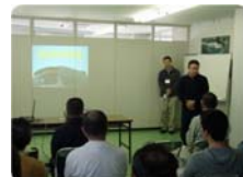
スライドを交えての分かりやすい講習内容でした。