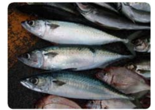
釣れたら面倒でも「活め」と「血抜き」は必ず行ないましょう。