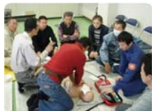
マリーナにも設置してあるAEDの使用方も実践しました。