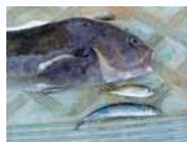
アジとイワシをエサに釣れたアイナメ。食欲は旺盛で、ルアーにもよく反応します。