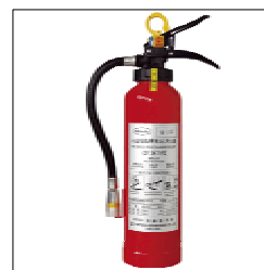
【小型船舶用手動粉末消火器】 予備でこれを搭載しておけばより安心です！