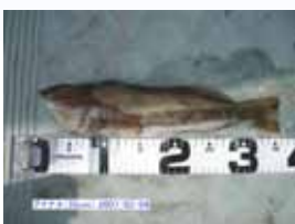
昨年2月に釣れた黄色の婚姻色のアイナメです。メスの産卵後はオスが卵を守るそうです。