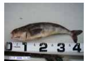
こちらは、ホッケです。アイナメにとっても良く似ています。