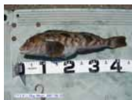
アイナメは感覚器官である「側線」を5つも持っている非常に敏感な魚です。