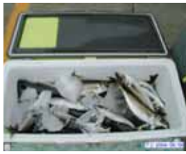
6月9日 沖でクーラーいっぱい釣れました。

(食味) 一年中釣れますが、一般的に脂が乗る5~8月が旬のようです。沖の回遊型と呼ばれるものは脂の乗りも少なく、味が落ちる反面この時期に現われる沿岸のものは、「関アジ」に代表されるように脂も乗っていてとても美味しいです。釣ったばかりの新鮮なものは、店頭のものとは比べられないほど「ぷりぷり」で刺身やたたきが一番ではないのでしょうか。その他、言うまでもありませんが、フライ・塩焼き・唐揚げ・干物など淡白でうま味があり、それでいてくせの無い身は何にでも合うのではないのでしょうか。