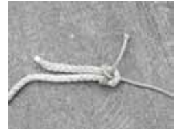
最後に、ロープのエンドに余裕を持たせてしっかりと締め込みます。