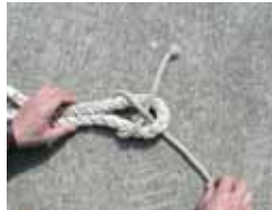
輪にした左側のロープを一周させ、最初に通したロープの下をくぐらせます。