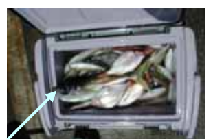
7月10日 ハナダイやキスと比べると大きさが分かります。

(食味) 一年中釣れますが、一般的に脂が乗る5~8月が旬のようです。沖の回遊型と呼ばれるものは脂の乗りも少なく、味が落ちる反面この時期に現われる沿岸のものは、「関アジ」に代表されるように脂も乗っていてとても美味しいです。釣ったばかりの新鮮なものは、店頭のものとは比べられないほど「ぷりぷり」で刺身やたたきが一番ではないのでしょうか。その他、言うまでもありませんが、フライ・塩焼き・唐揚げ・干物など淡白でうま味があり、それでいてくせの無い身は何にでも合うのではないのでしょうか。