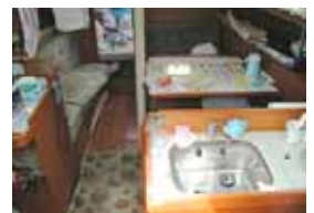
広くて使いやすいそうな船内。クルーに女性がいるせいか、清潔に片付けられていました。