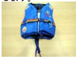
< 低学年用救命胴衣 >

サイズは 2 種類で、小学校低学年用 10 着・小学校高学年用 20 着、計 30 着をマリーナにて保管・管理いたします。ご利用方法は、出港の際に窓口にて貸出し簿に必要事項をご記入いただき、その場でお貸しいたします(事前予約可)ので、ぜひご利用くださいますようお願いいたします。