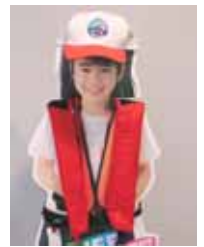
< 子供用自動膨張式・救命胴衣 >

落水時に本体に内蔵されたセンサーが感知し、炭酸ガスにより本体が膨張します。子どもでも、着用感を感じることなく着ることができます。マリーナのロビーにて販売しております。