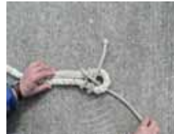
曳航などで強い力が加わる状況では、写真のように2回通したほうがよりほどけにくくなります。