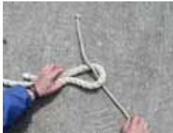
一方のロープを輪にし、その中にもう一方のロープを下から通します。(この場合)

2本のロープを結ぶにはこの結び方しかない！と言い切れるほどの結び方がこのシートバンドです。結びやすく解きやすいこの結び方は、ヨット・ボート乗りとしては必ず覚えなければならない結び方のひとつとしてあげられるものです。また、レスキューの際にこちらから曳航用のロープを受け取ったら、自船の船首のロープ(1本ないし2本)にこの方法でつないでいただければ、安全で確実な曳航が可能となりますので、ぜひこの機会にすばやくロープ同士をつなぐことが出来るように練習してみてください。