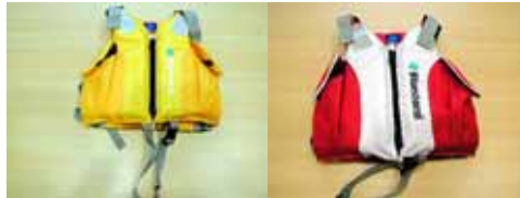
< 高学年用救命胴衣 >