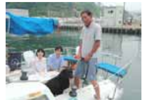
当日横浜から遊びに来られた息子さんと3人(+1匹)で記念撮影!