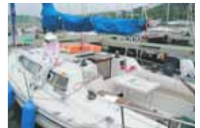
とても仲の良いお二人。お互いの協力が無いと成り立たない船上生活なので、ケンカなどしてはひまが無いのでしょうか。