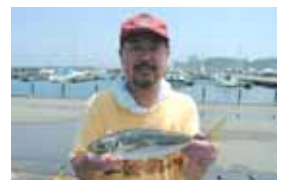
7月4日 30cmの大型。丸々と太ってました。

(解説) アジと一口に言っても色々な種類がありますが、一般的に言うアジとは「マアジ」のことを指します。特徴は「ゼンゴ」と呼ばれる体の側面にある硬いウロコで、この数によって仲間を区別するそうです。また、沿岸のものは背中が黄色っぽく、沖のものは黒っぽいという違いもあります。食性は主にプランクトンを捕食し、成長と共に小型の魚やイカも食べるようになります。浅場に移動してくる産卵期のこの時期が型も大きく、数も釣れるのではないのでしょうか。